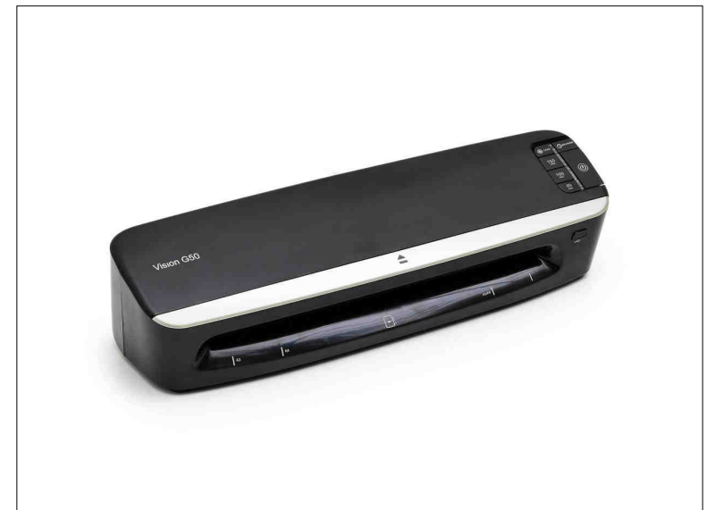
Laminátor VISION G50