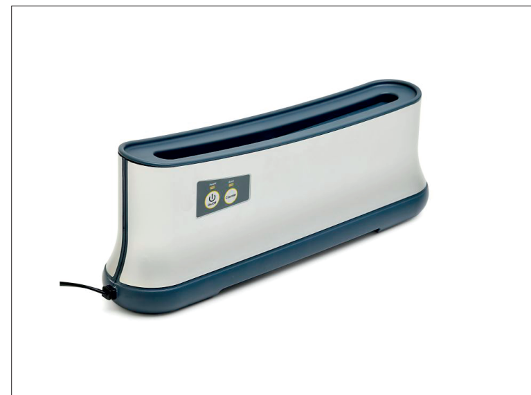
Termovazač TB 200