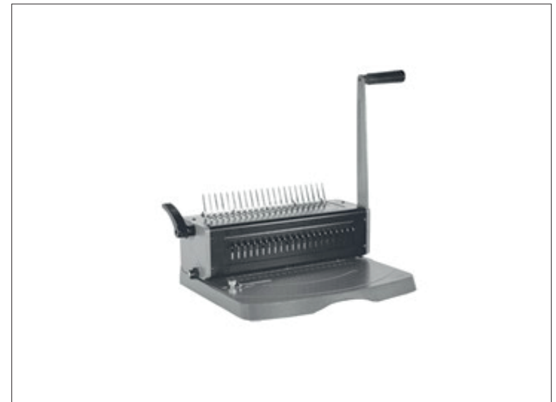
Rychlovazač HP 2388