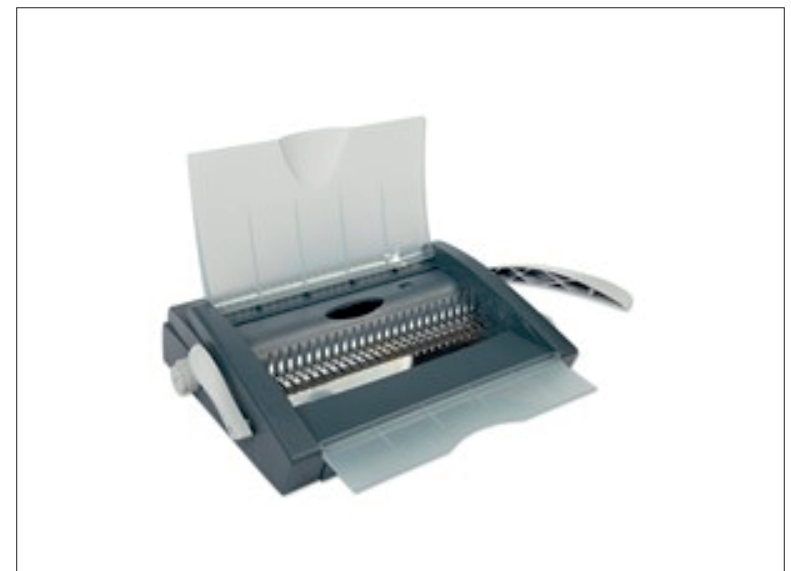
Rychlovazač JAZON, JAZON Plus