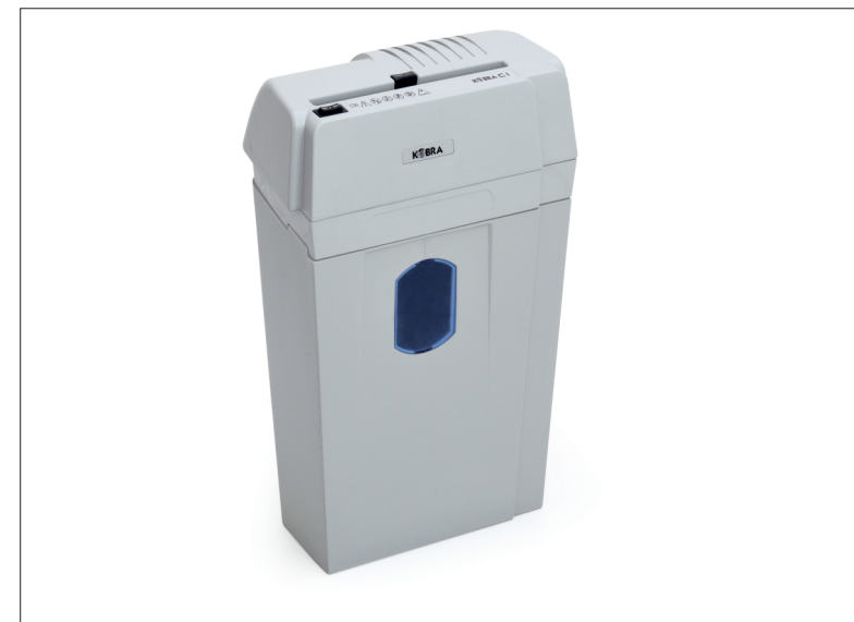
Skartovací stroj KOBRA C1